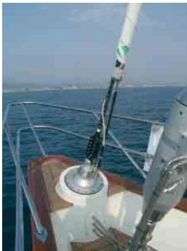
Perini Navi45 m. s/y "numero uno"