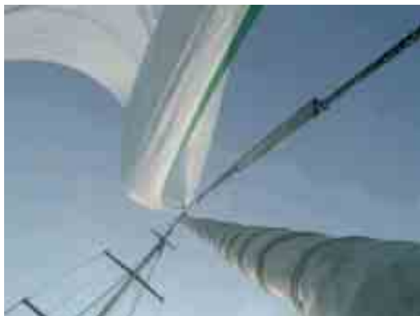
Longueur étai 38 m.

Lorsqu'il est utilisé comme RollGen®, le système permet d'enrouler des voiles asymétriques tel qu'un Spi Asymétrique ou un Gennaker ayant le bord d'attaque libre non endraillé; s'il est utilisé comme enrouleur de voiles ayant le bord d'attaque endraillé sur un étai flexible, il permet au contraire d'enrouler des voiles comme un Code "o" du type drifter ou le génois top.